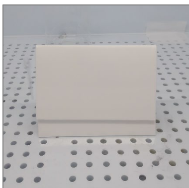
图 4 PP 板示图