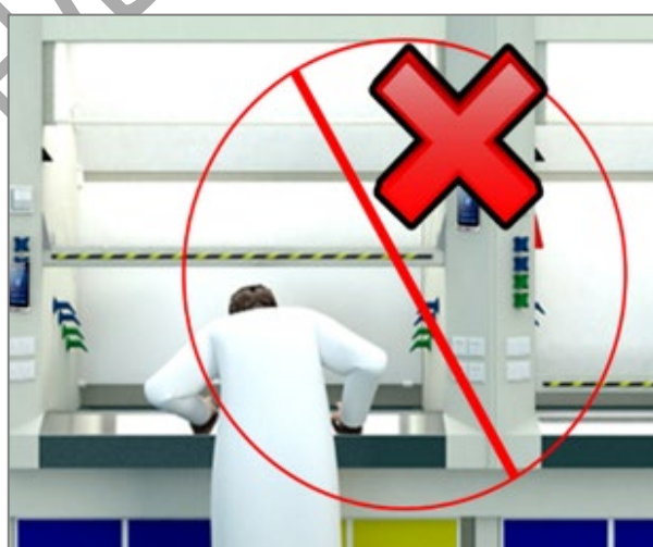
图 2 安全距离及禁止的危险行为