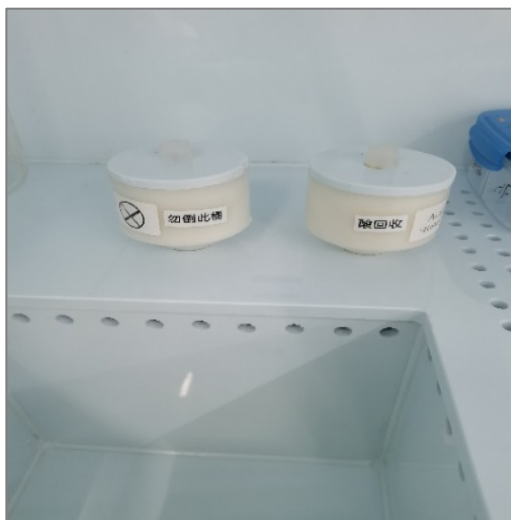
图 6 废液回收槽