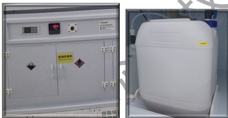
图 7 通风橱下方酸废液桶位置