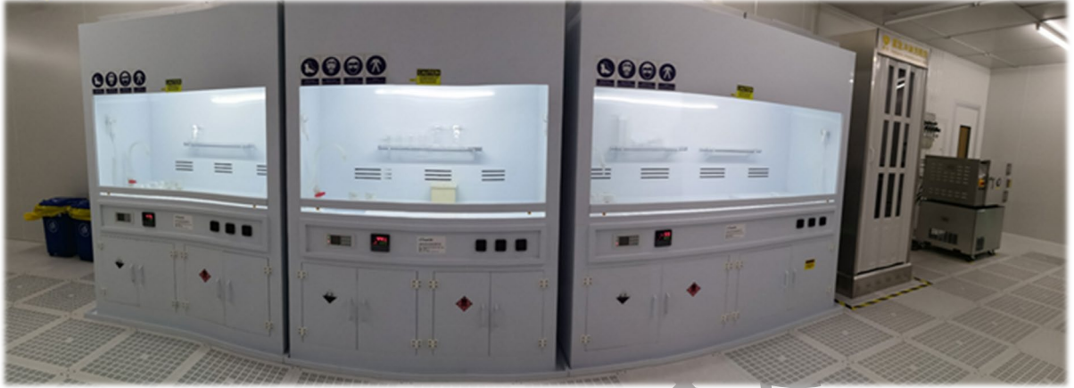
图 8 通风橱位置（左）