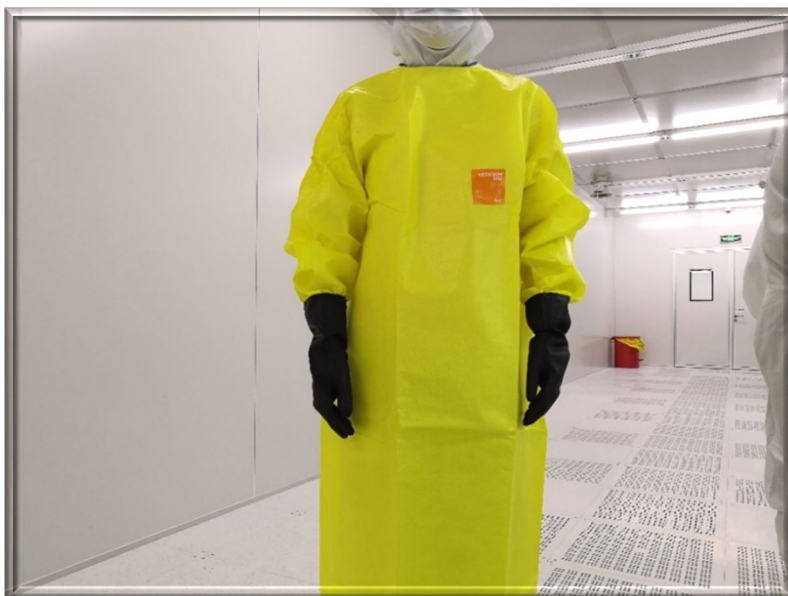
图 1 使用 HF、BOE 处理样品时所需的防护服及专用手套示意图