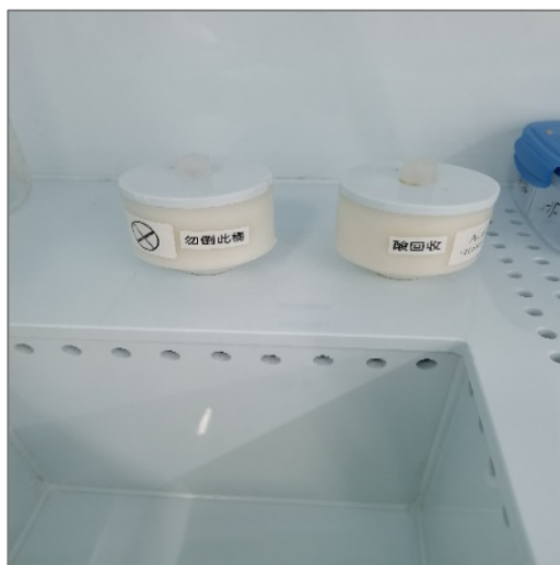
图 6 废液回收槽