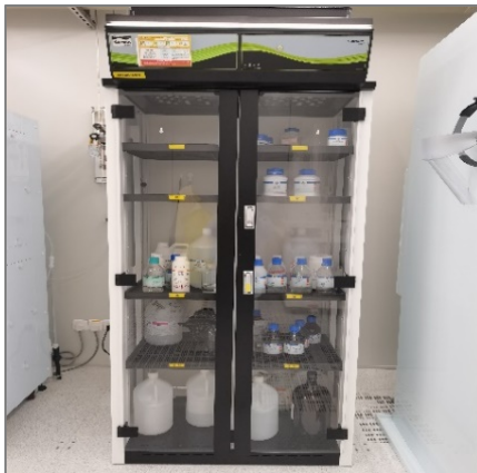
图 3 化学药品存储柜