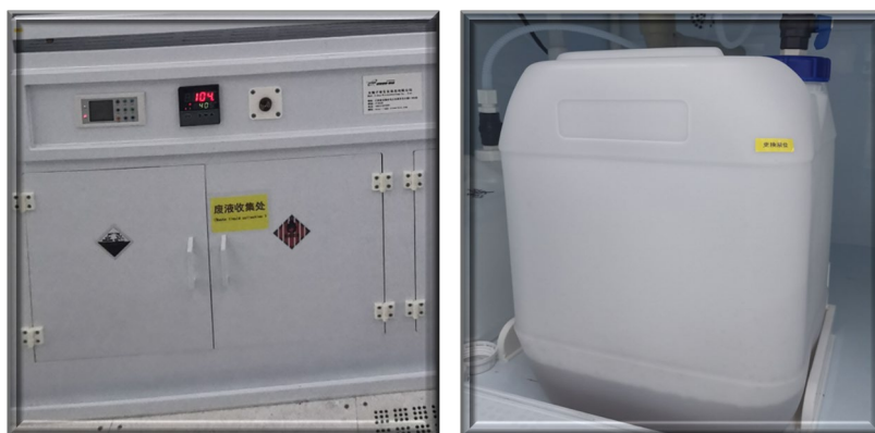
图 7 通风橱下方酸废液桶位置