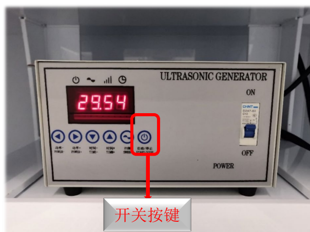
图 12 通风橱超声清洗机面板