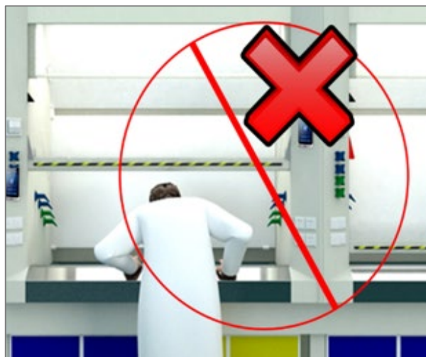
图 2 安全距离及禁止的危险行为