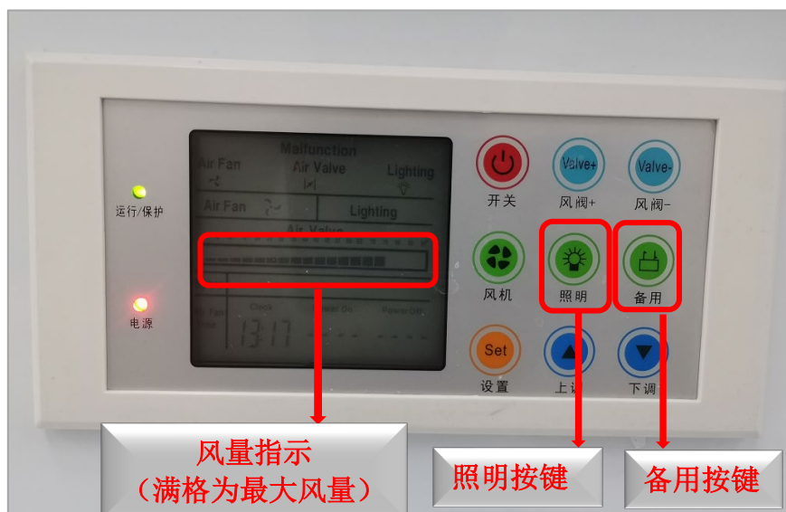
图 10 操作界面图片