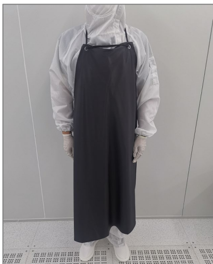
图 1 使用酸处理样品所需的防护装备