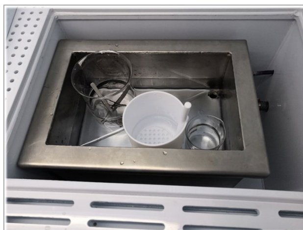
图 11 通风橱超声清洗机