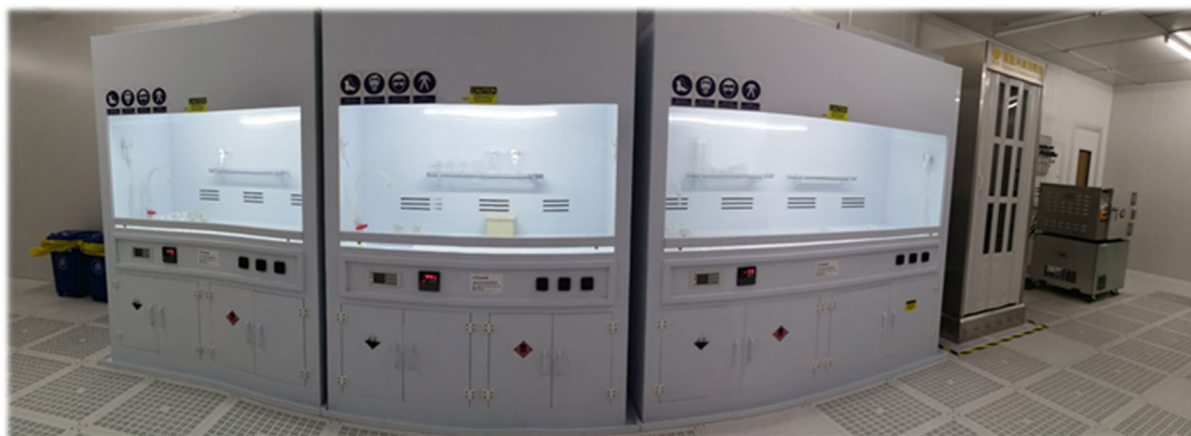
图 8 通风橱位置（左）