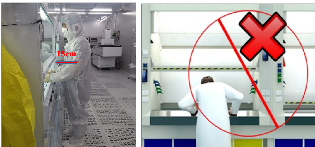
图 2 安全距离及禁止的危险行为