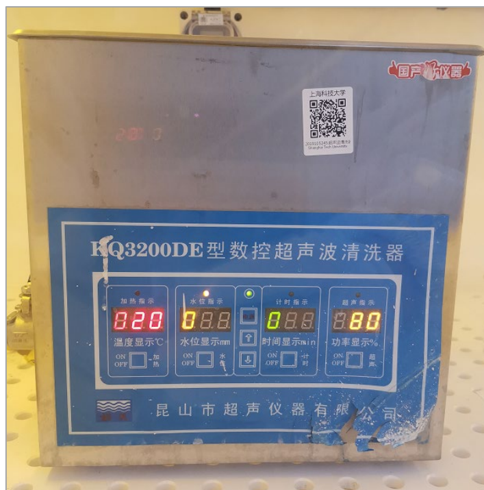
图 9 通风橱超声清洗机面板