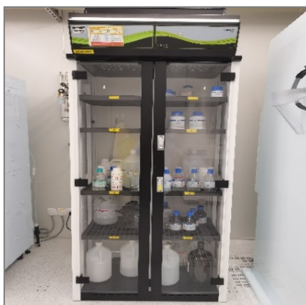
图 2 化学药品存储柜