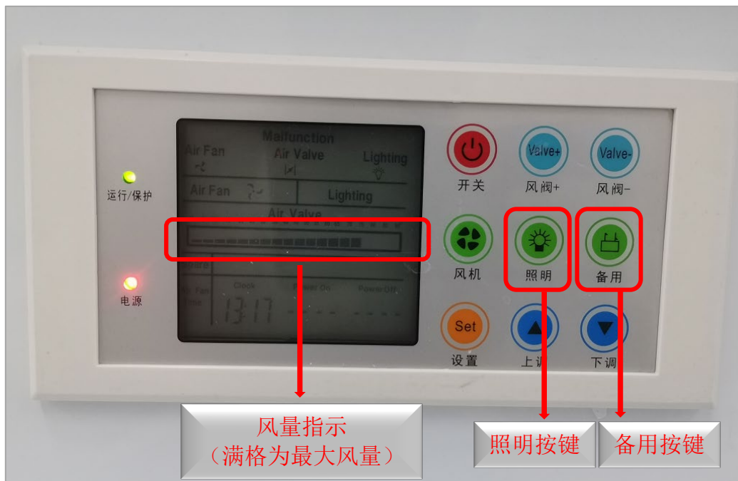
图 8 操作界面图片