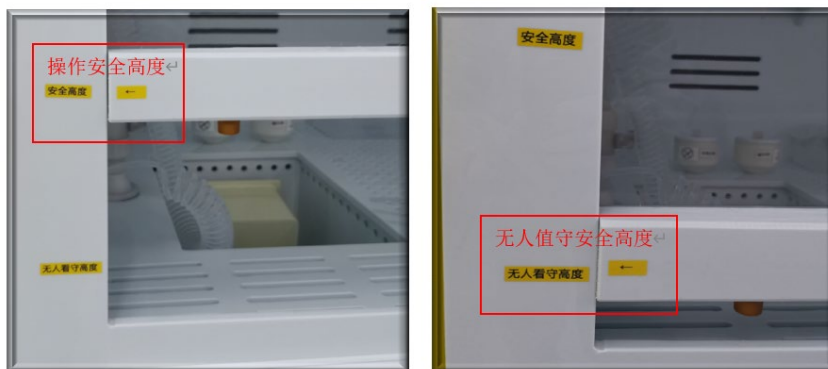
图 4 通风橱面板的规范高度