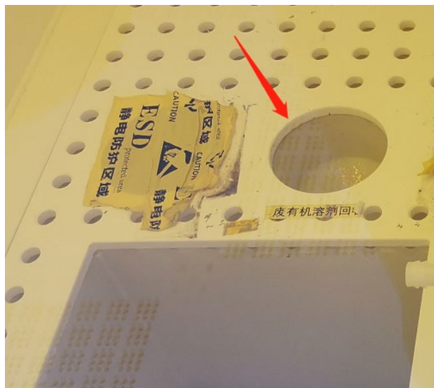
图 5 废液回收槽